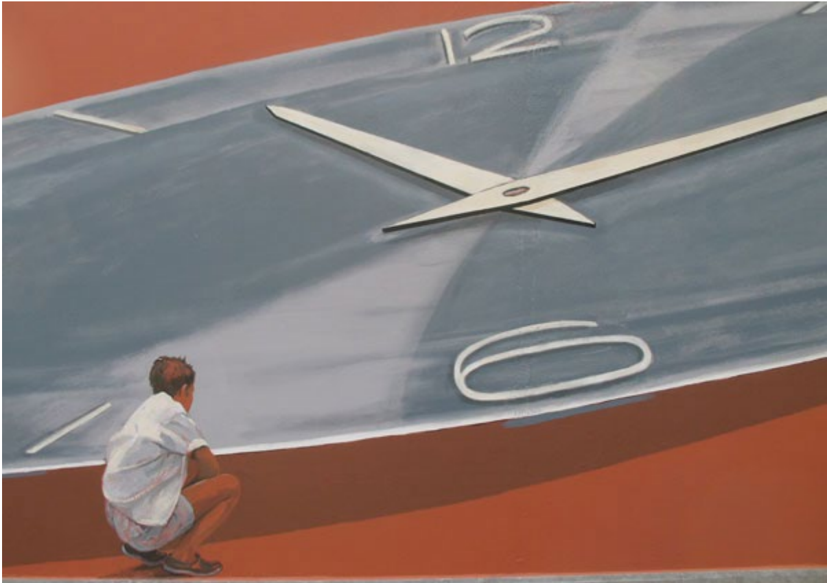
Nora Theys en Gal (2008). Muurschildering 'Zin in gezin?'. Brussel: campus Schaarbeek (Gezinswetenschappen, Odisee).